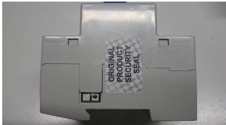
Targa / Marking plate